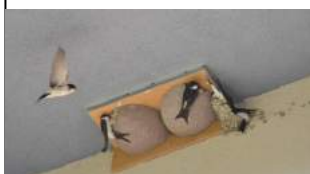
Hirondelles de fenêtre